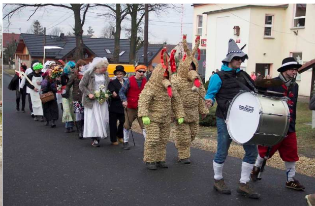
i w tradycyjnym słomianym stroju...w Raszowej

W tym roku po raz pierwszy w naszej szkole odbędzie się wodzenie niedźwiedzia. Imprezę zorganizują uczniowie Kółka historycznego i Samorząd Szkolny. Odbędzie się 13 lutego i będzie połączona z walentynkami.