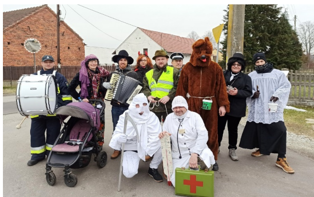
Wodzenie Niedźwiedzia w Spóroku

Wodzenie niedźwiedzia kończy zabawa z misiem w karczmie, podczas której jest on publicznie oskarżony o wszystkie niepowodzenia, nieszczęścia i zło, jakie spotkało ludzi w minionym roku i za to skazany na odstrzelenie przez leśniczego. Na pocieszenie stary niedźwiedź zostawia małego niedźwiadka, który gwarantuje, że tradycja wodzenia niedźwiedzia będzie kultywowana w przyszłym roku.