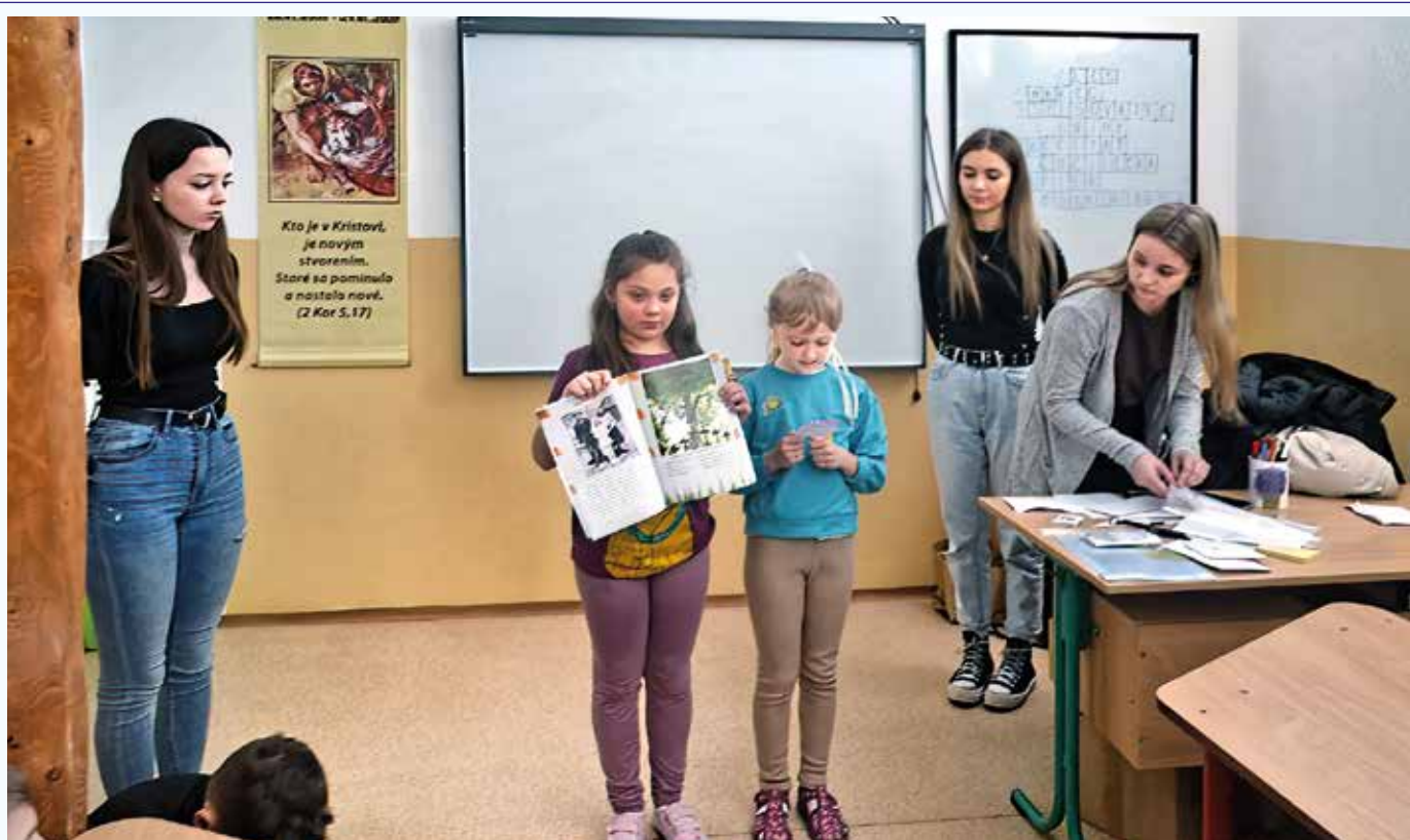
Stredoškolačky prezentujú knihu LeSníček