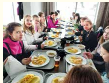
Po lyžovačke nám poriadne vytrávilolo. Mňam!

Dňa 15. februára bol posledný deň nášho lyžiarskeho výcviku. Myslím, že všetci sme si priali, aby trval ešte ďalší týždeň a nemuseli sme sa vracieť do školy. V ten deň sme mali aj súťaž v slalome o to, kto bude najrýchlejší lyžiar. Tí najlepší si odniesli so sebou medaily a všetci spolu sme sa tešili