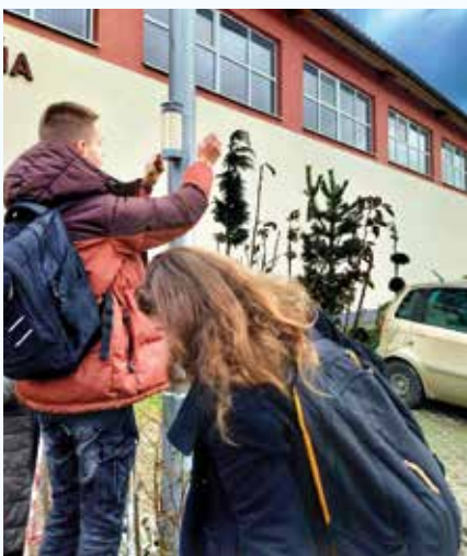
Deviatáci pripevňujú merač znečistenia ovzdušia.

Tento projekt má za úlohu zlepšovanie kvality ovzdušia.