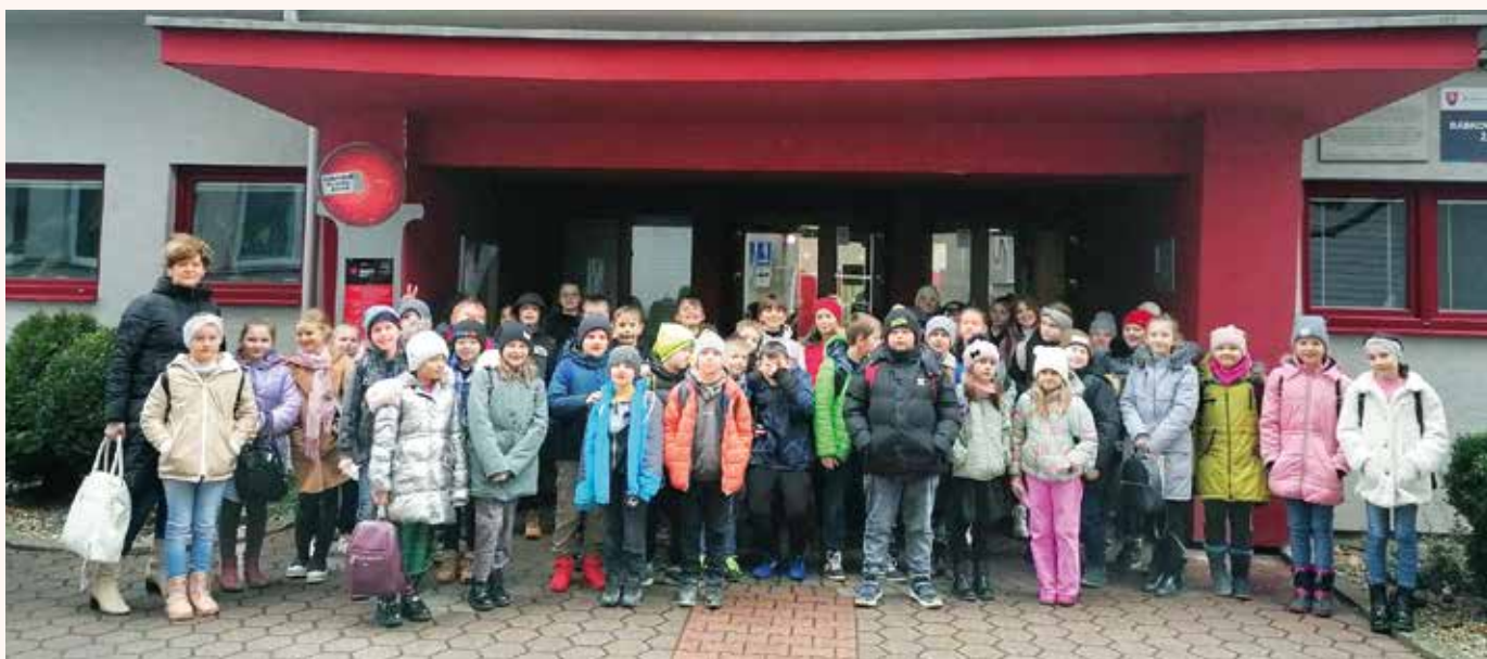
Žiaci 4.A a piatáci v Bábkovom divadle v Žiline.