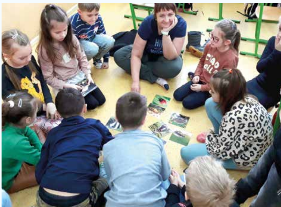
Deti riešia tvorivé úlohy o zvieratkách.