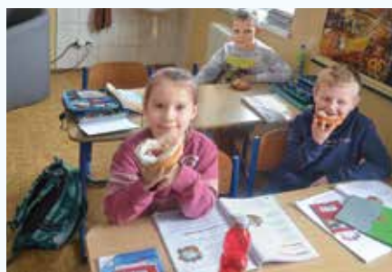
Fašiangy sme zakončili sladkými šiškami

Tohtoročný pôst začal 22. februára. Deň predtým sme sa naň v tichosti pripravovali pri vyloženej sviatosti