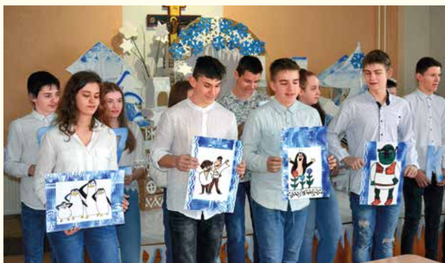
Deviataci pripravili pre malých prvákov tvorivé aktivity

Všetci prváci úlohy zvládli a prebojovali sa svojimi vedomosťami ku konečnému pasovaniu za prváčikov. Na konci každý z nich dostal diplom. Celá 9.A. sme do toho vložili kopec úsilia a verím, že sa to prváčikom a ich rodičom páčilo a zabavilo sa.