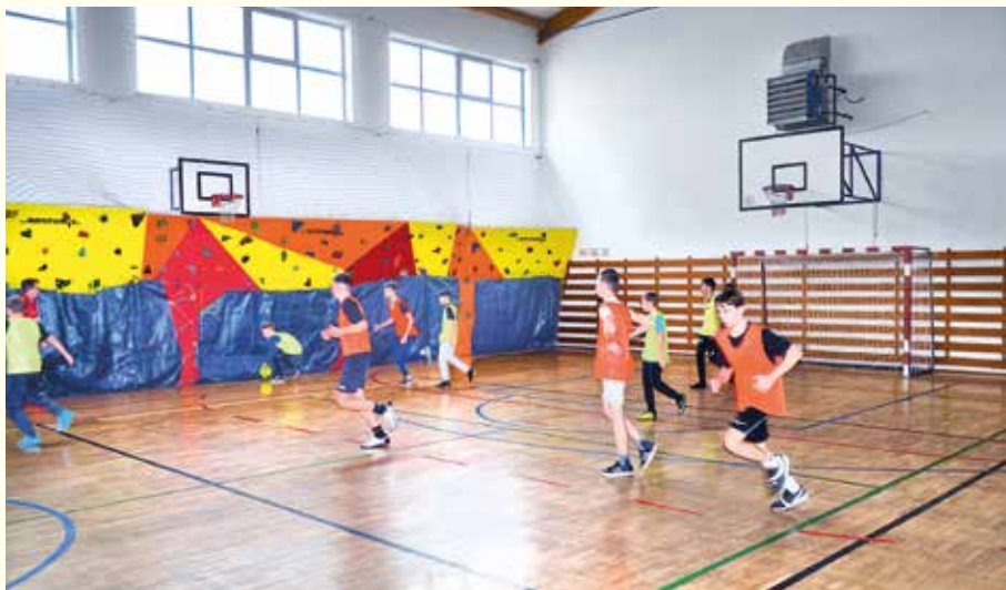
Turnaj so žiakmi z Nových Zámok