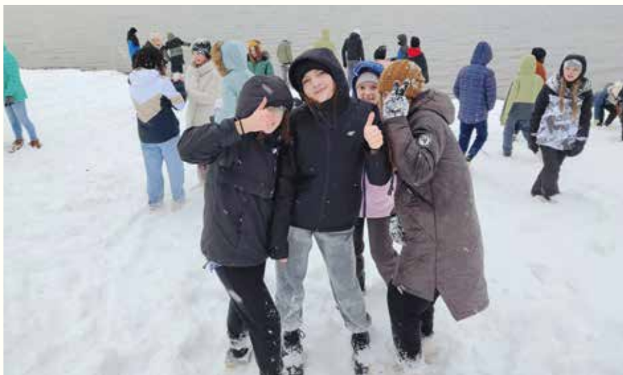
Guľovačka pri Oravskej priehrade