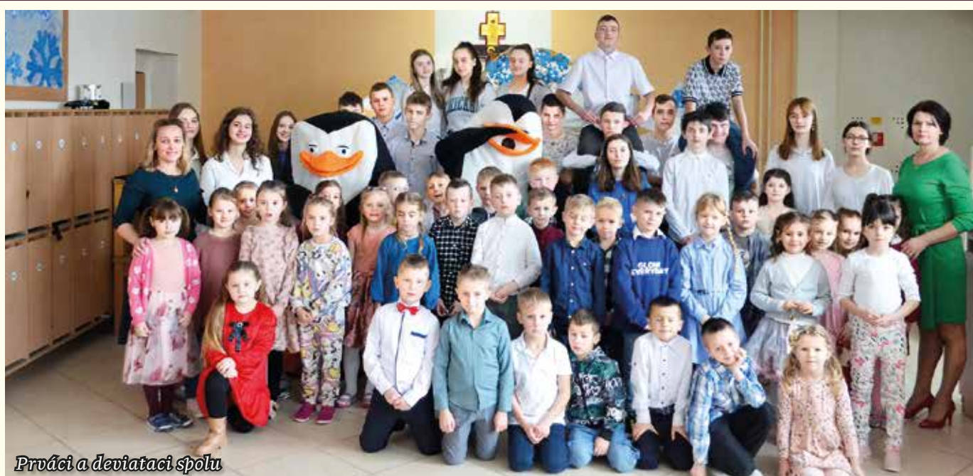
Prváci a deviataci spolu