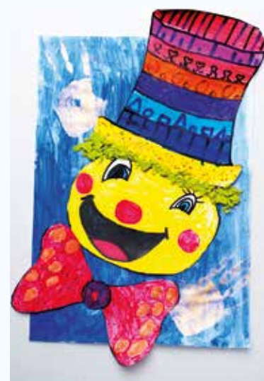
Skarlet Košútová, 4.A