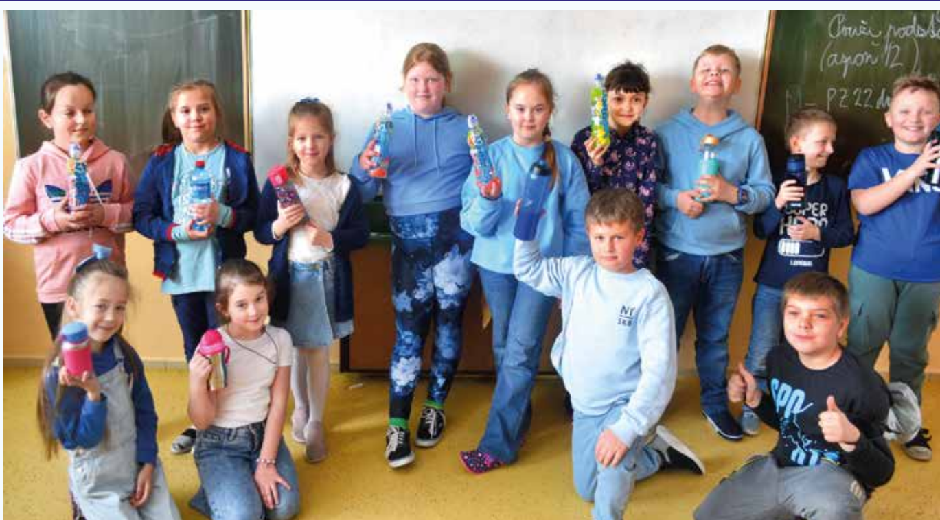
3.B v modrom oblečení a s vodičkou