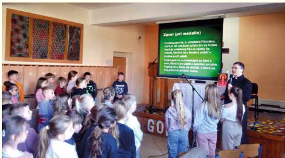
Na záver prednášky sme sa k tejto svätici pomodlili.