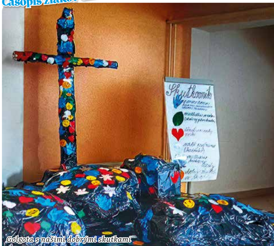
Golgota s našimi dobrými skutkami

Časopis žiakov Cirkevnej základnej školy sv. apoštola Pavla v Sihelnom č. 1/2023