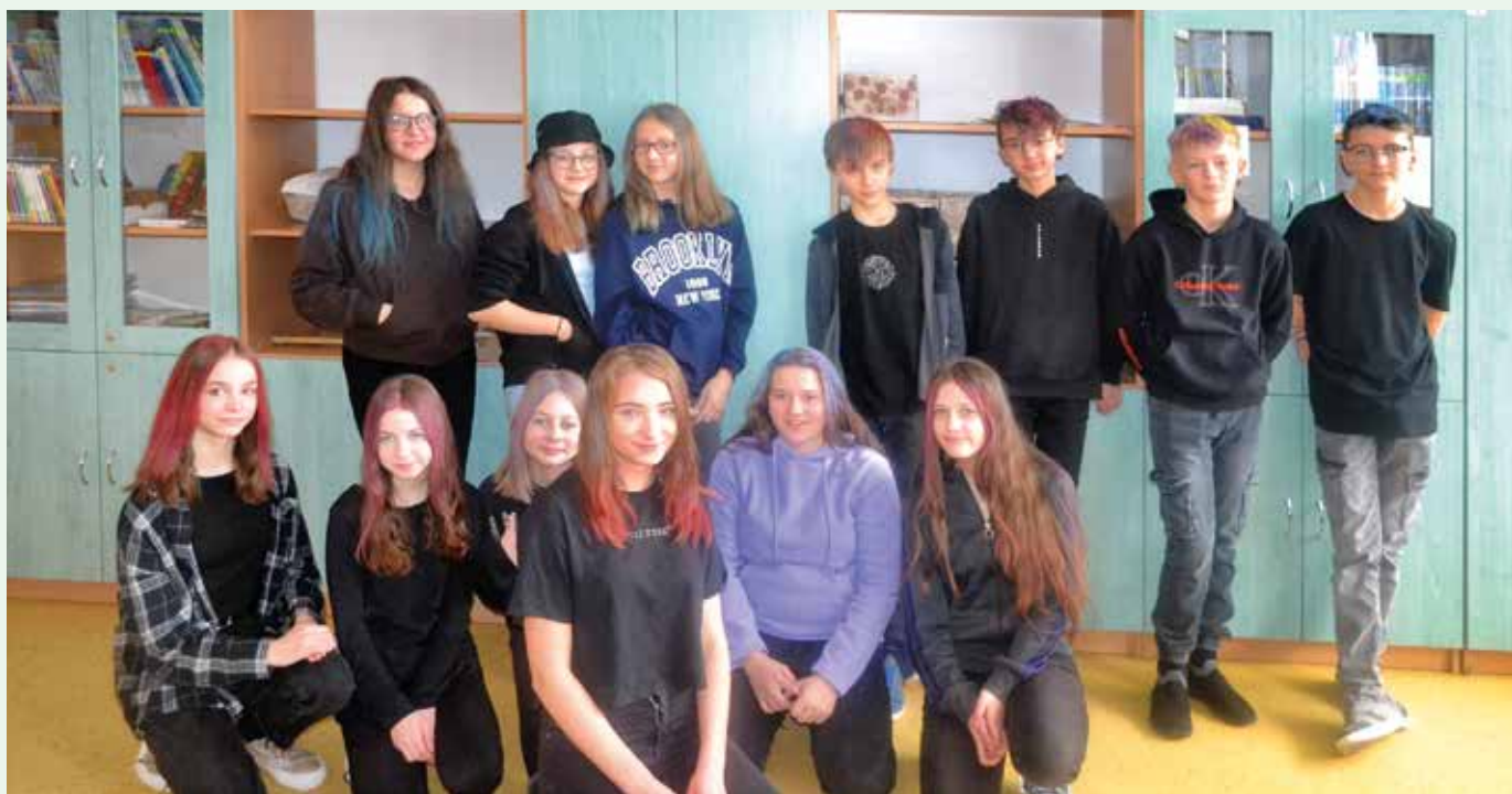
Žiaci 8.B s farebnými vlasmi