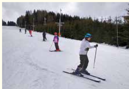
Hurá, už vieme lyžovať!

nevedeli, sa naučili lyže výborne ovládať.