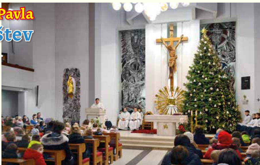
Odpustová svätá omša s našim dekanom

Po nej čakalo na malých prvákov pasovanie za riadnych žiakov našej školy, ktoré si pre nich pripravili ich pani učiteľky s deviatakmi. Pozvaní boli aj ich rodičia.