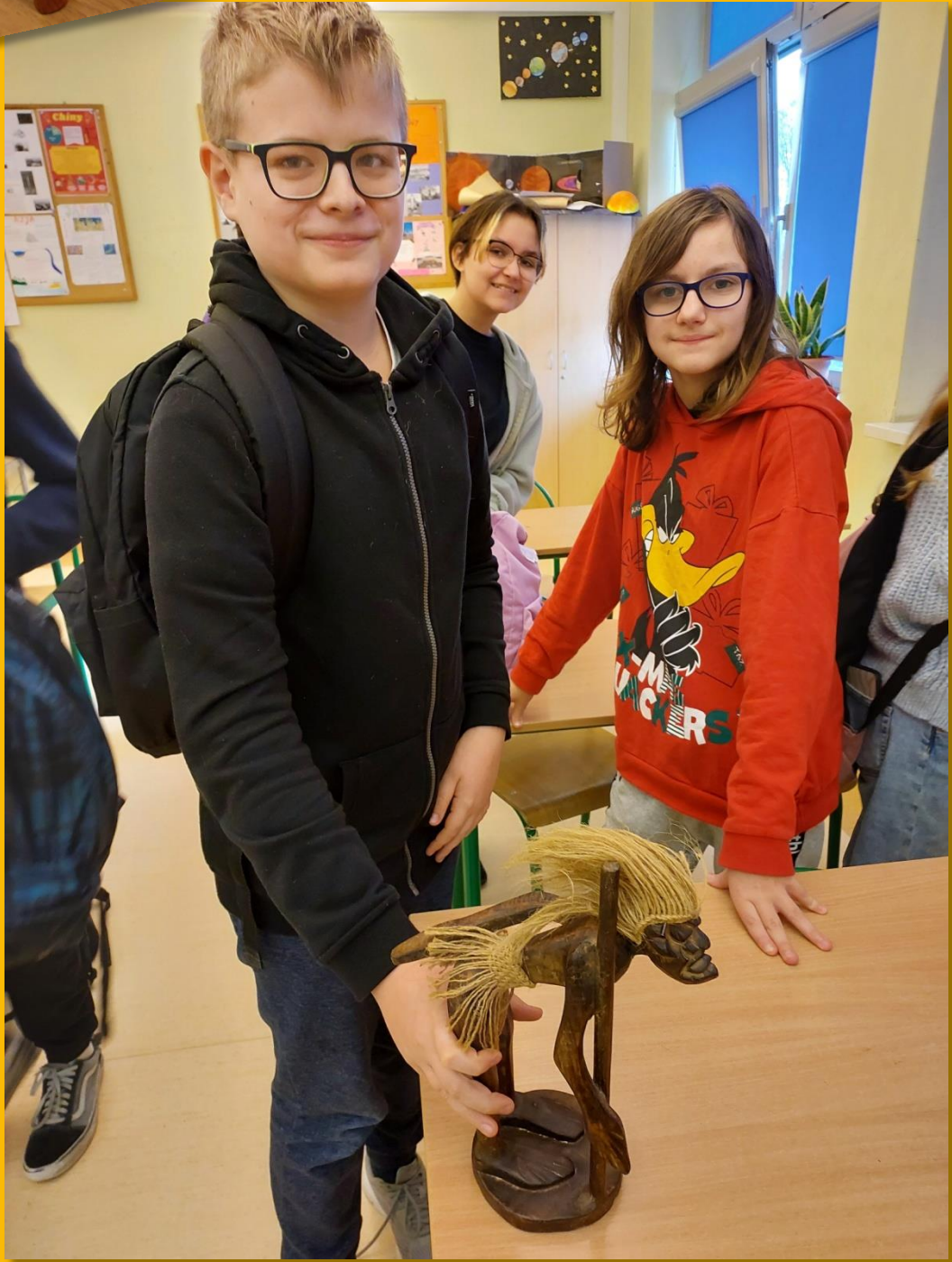
Klasa 8F zapoznaje się z szamanem 😊