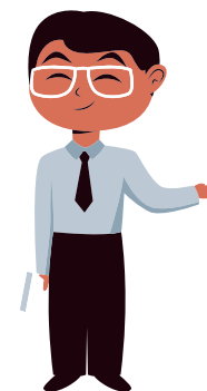
Riaditeľ školy/ školského zariadenia

Krok č. 1: Žiadateľ podá Žiadosť o vypracovanie vyjadrenia na účel poskytnutia podporného opatrenia.