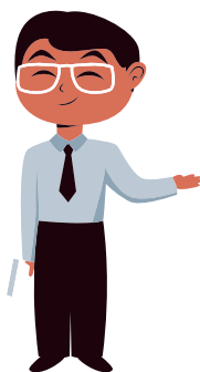
Riaditeľ školy/ školského zariadenia

Krok č. 7 - Ak RÚŠS zistí, že vyjadrenie riaditeľa je OPODSTATNENÉ, vykoná všetky potrebné úkony na zabezpečenie poskytnutia podporného opatrenia.