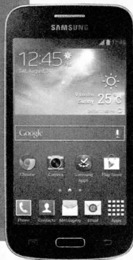
Samsung GALAXY CORE Plus

ePOUKAZ Poštová banka, a.s. Dvořákovo nábřeží 4, 811 02 Bratislava zapisaná v OR Okresného súdu Bratislava I o.d. 3a, v. č. 501/B, IČO 31 340 890