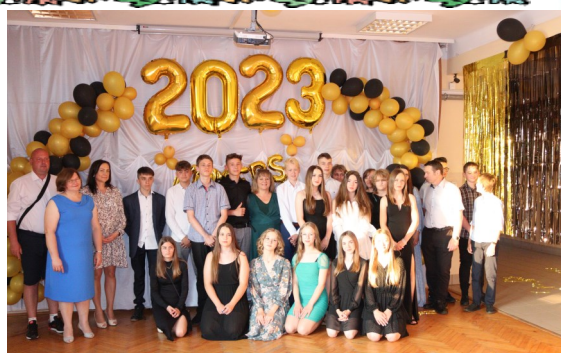
Absolwenci bawili się doskonale.

20 czerwca 2023r. w naszej szkole odbył się pożegnalny komers uczniów klas ósmych. Wszyscy nasi absolwenci przyszli niezwykle elegancko ubrani i wyszykowani na ostatnią w murach swojej szkoły zabawę. Przygotowana ona została wraz z poczęstunkiem przez rodziców uczniów klas ósmych. Na komers przybył również pan dyrektor oraz nauczyciele.