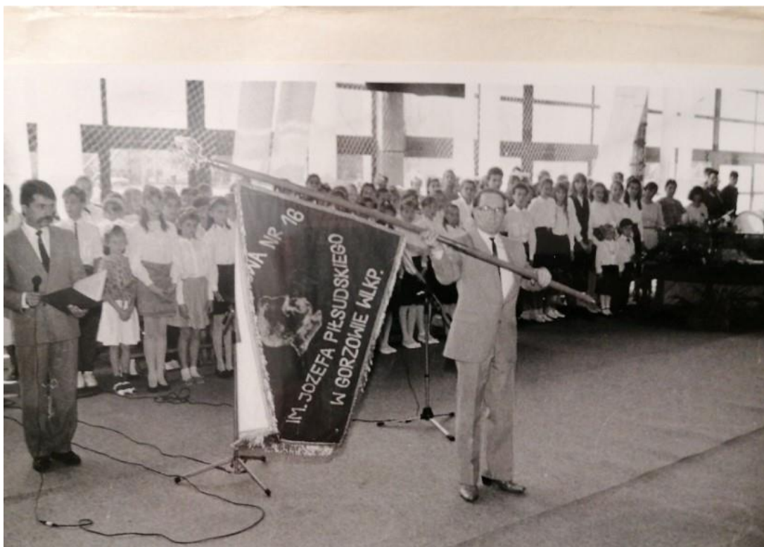
Rys. 12. Uroczystość nadania szkole patrona

Dalsze wybory związane były z kampanią wykorzystującą ciekawe hasła. Starsi najbardziej popierali wybór Józefa Piłsudskiego na patrona. Głosili hasła: „Pierwszy raz możesz wybrać, wybierz Piłsudskiego”, „Głosuj na Józefa Klemensa Piłsudskiego - człowieka niesłusznie oskarżonego”. Oprócz tego w szkole często można było usłyszeć słowa pieśni My, pierwsza brygada . Także zwolennicy Stanisława Staszica popierali swojego