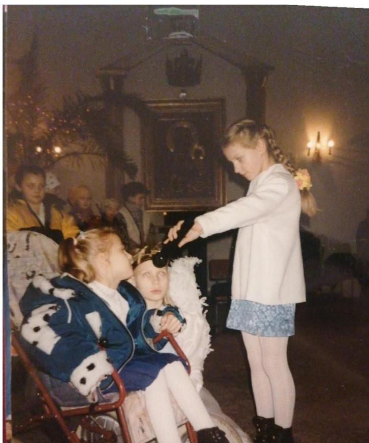
Rys. 15. Jasełka, rok szkolny 2000/2001

Wśród akcji cyklicznych dużym zainteresowaniem cieszyły się szczególnie Aktywne przerwy , podczas których uczniowie klas I-III mogli spędzić czas, bawiąc się, tańcząc i pływając razem z Łazikami. Przerwy na sprzątanie prowadzone przez zuchy zaangażowały wielu uczniów w dbanie o czystość terenu dookoła szkoły. Akcją, która rozwijała się, było też Czytanie na dywanie podczas długich przerw śródlekcyjnych na korytarzu szkolnym. Bajki czytały zuchy, pozwalając słuchaczom na relaks oraz wyciszenie się i poznanie nowych bajek i baśni.