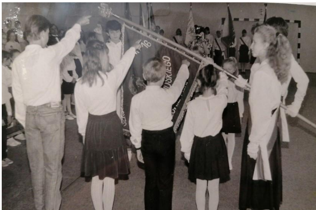
Rys. 13. Uczniowie składają śluby na sztandar. Uroczystość nadania patrona