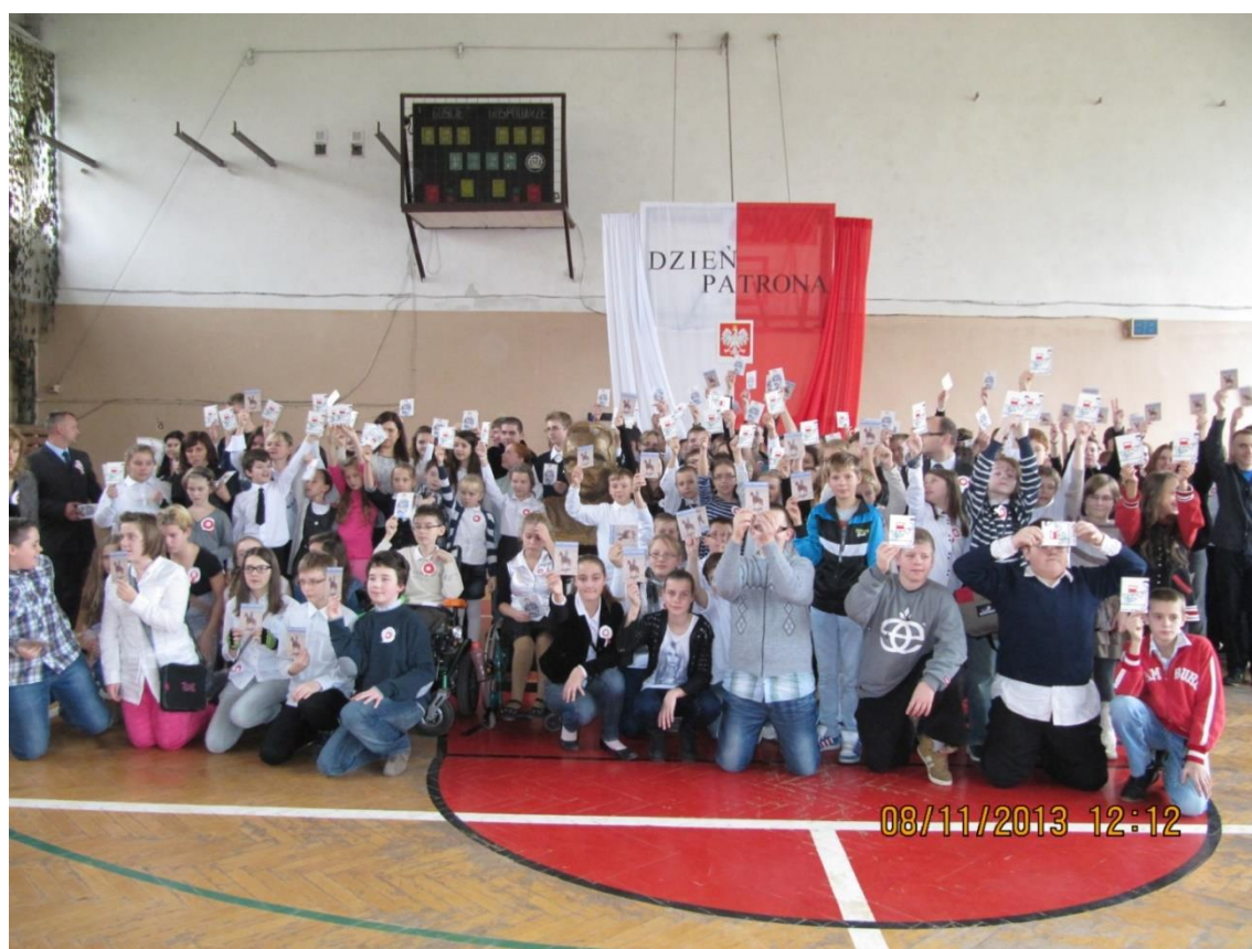
Rys. 52. Nauczyciele, pracownicy szkoły i uczniowie prezentują kartki w ramach akcji Mamy Niepodległą! , które następnie zostaną wysłane do bliskich im osób, rok 2013