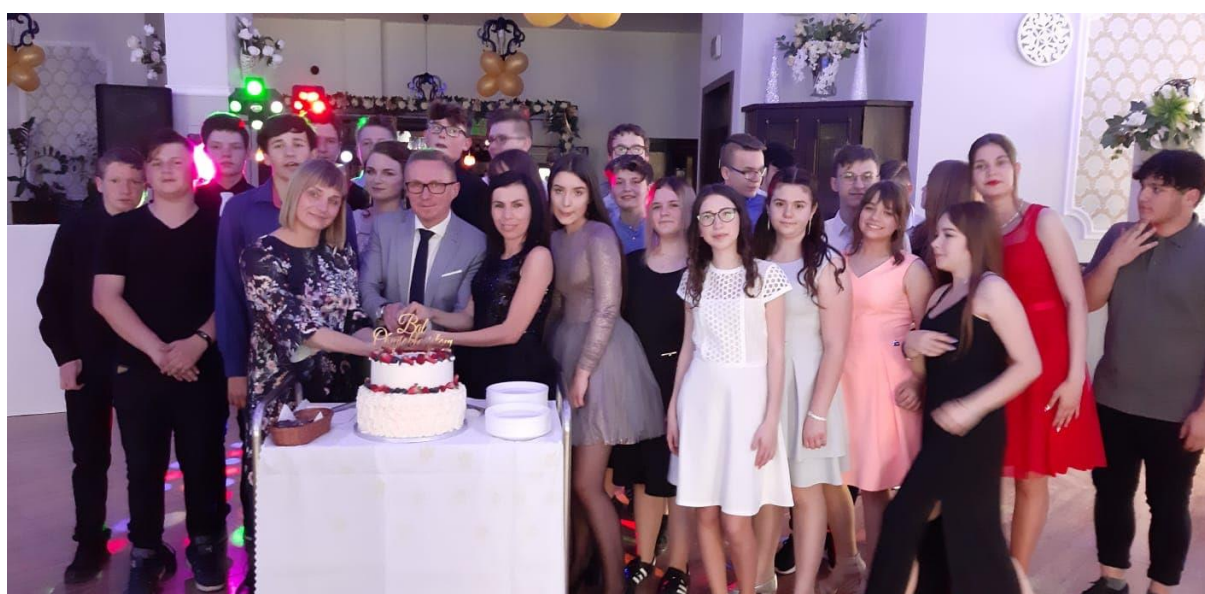
Rys. 28. Bal ósmoklasisty w 2019 r., pierwszy raz od powrotu 8-letnich szkół podstawowych.