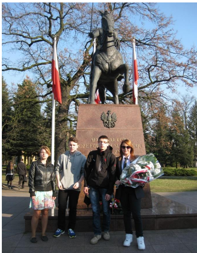
Rys. 42. Uczniowie liceum składają kwiaty przed pomnikiem marszałka Józefa Piłsudskiego