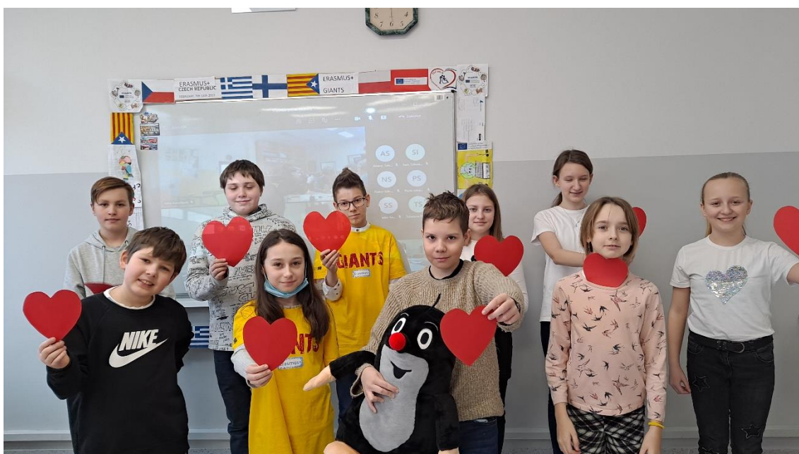
Rys. 39. Pomimo pandemii Covid-19 uczniowie klas 5 i 6 realizują program Erasmus +