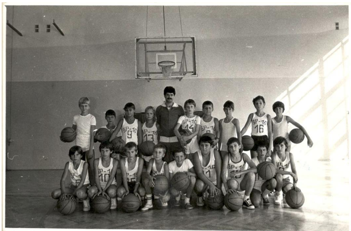
Rys. 30. Działalność sportowa ZSO 16