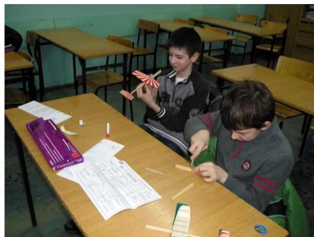
Rys. 53. Szkolne Koło Modelarskie

Szkolne Koło Modelarskie oficjalnie rozpoczęło działalność od spotkania organizacyjnego, które odbyło się w czwartek 15.10.2009 r. Od tego momentu w kolejnych latach na cotygodniowych spotkaniach zbierali się cyklicznie młodzi entuzjaści modelarstwa. W trakcie zajęć budowano najpierw proste modele szybowców halowych z drewna balsowego, potem te bardziej skomplikowane klasy F1AM, dziewczęta i chłopcy próbowali swoich sił również przy wykonaniu i oblatywaniu balonów na ogrzane powietrze. Jednak głównym obiektem zainteresowania szkolnych modelarzy były zdalnie sterowane radiem (RC) modele kołowe w skali 1:10 samochodów zarówno terenowych klasy buggy E-10, jak i torowych klasy TC 1/10.