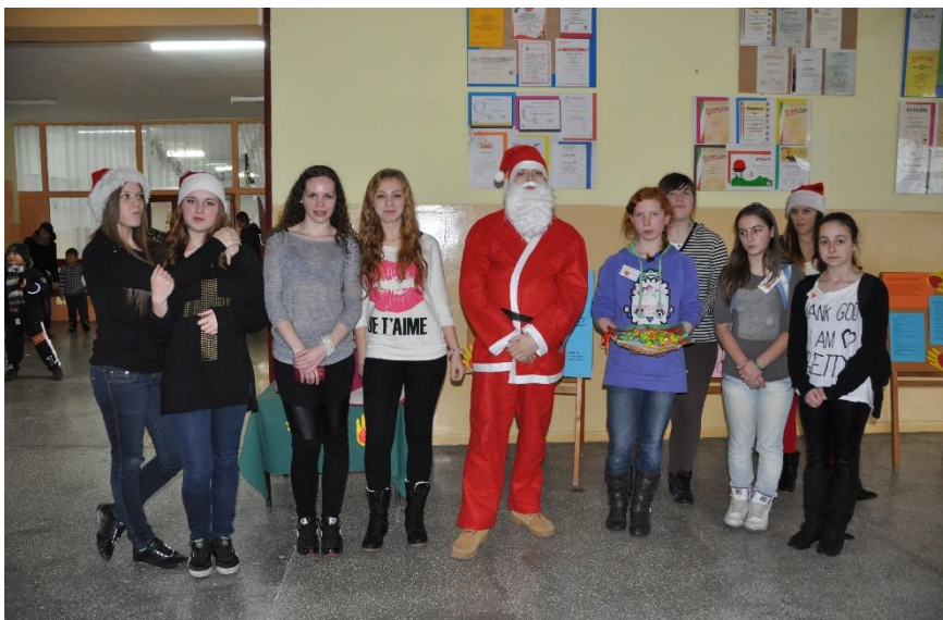
Rys. 44. Część wolontariuszy naszej szkoły