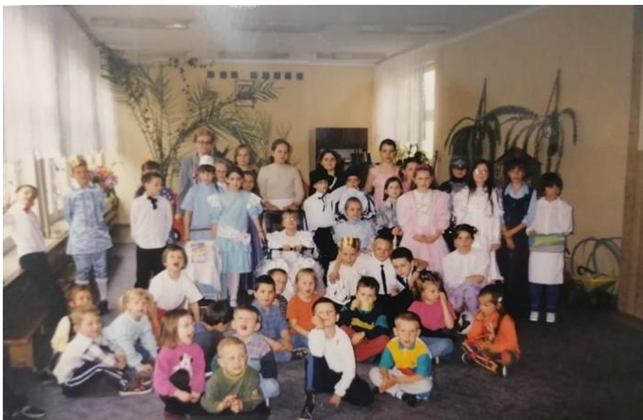
Rys. 17. Uczniowie klas I-III z teatrzyku „Kubuś” po przedstawieniu pt. „Kopciuszek” w przedszkolu nr 21