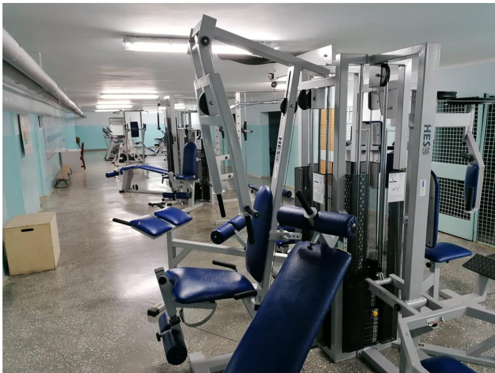
Rys. 38. Część naszej siłowni szkolnej

Oprócz bardzo dobrze wyposażonej siłowni w naszej szkole funkcjonuje również strzelnica, a zajęcia na niej są wpisane w program nauczania lekcji wychowania fizycznego od klasy 7 szkoły podstawowej. Oczywiście zajęcia te odbywają się pod czujnym okiem naszych nauczycieli, którzy przeszli specjalne szkolenie.