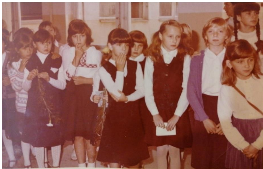
Rys. 4. Uczennice klas IV czekające na przydział do poszczególnych klas

Organizacja szkoły w drugim roku, pomimo pewnych mankamentów, wyglądała zdecydowanie lepiej. Wszystkie segmenty i łączniki były już oddane do użytku, co pozwoliło uruchomić zarówno świetlicę, która zajęła pomieszczenie po dawnej prowizorycznej bibliotece, jak i wyczekiwaną przez wszystkich stołówkę, żywiącą 600 dzieci. W październiku szkoła