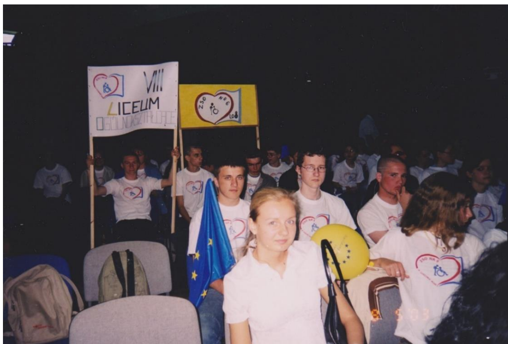
Rys. 21. Uczniowie naszej szkoły na spotkaniu z prezydentem Aleksandrem Kwaśniewskim