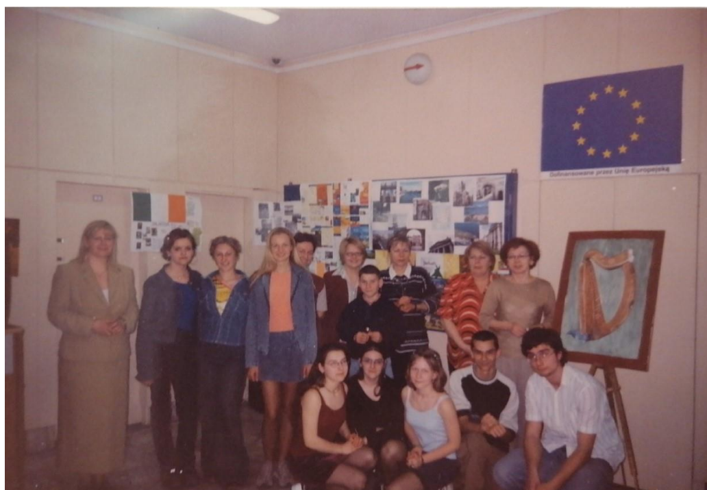
Rys. 20. Uczniowie i nauczyciele z VIII LO przy ZSO 16, a także pracownicy Urzędu Wojewódzkiego

Nasza szkoła już od 2003 r. należy do kręgu europejskich szkół, które dbają, szanują i promują kulturę zachodnioeuropejską, jednocześnie rozpowszechniając wśród uczniów zachowania i tradycje innych krajów. W kwietniu 2003 r. szkoła wzięła udział w projekcie zorganizowanym przez Urząd Wojewódzki. Projekt miał na celu zaangażowanie szkół ponadgimnazjalnych w promocję jednego konkretnego państwa z Unii Europejskiej, wszystko było powiązane z przystąpieniem Polski w 2004 r. do UE. Naszej szkole przypisano Irlandię. 16.04.2003 r. uczniowie VIII LO zaprezentowali program wokalnno-taneczny powiązany z Irlandią. Zadanie, choć trudne, nie stanowiło problemu dla naszych uczniów, część z nich bowiem tworzyło grupę wokalną. Wykonano utwory „Sometimes” i „Kocham Cię jak Irlandię”. Przedstawiciele naszej szkoły wzięli także czynny udział w spotkaniu z ówczesnym prezydentem Polski, Aleksandrem Kwaśniewskim, które miało miejsce w Gorzowie 08.05.2003 r. Na spotkaniu tym pan prezydent apelował do gorzowskiej młodzieży o udział w wyborach referendalnych, które odbyły się 7 i 8 czerwca. Przekonywał na spotkaniu o istocie i konieczności przystąpienia Polski do UE i wynikających z niej korzyści. Jego wystąpienie cieszyło się dużym zainteresowaniem wśród uczniów.