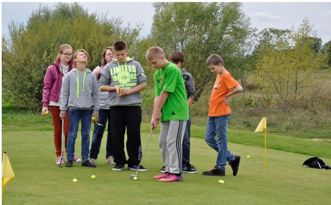
Rys. 36. Uczniowie ZSO 16 uczą się grać w golfa