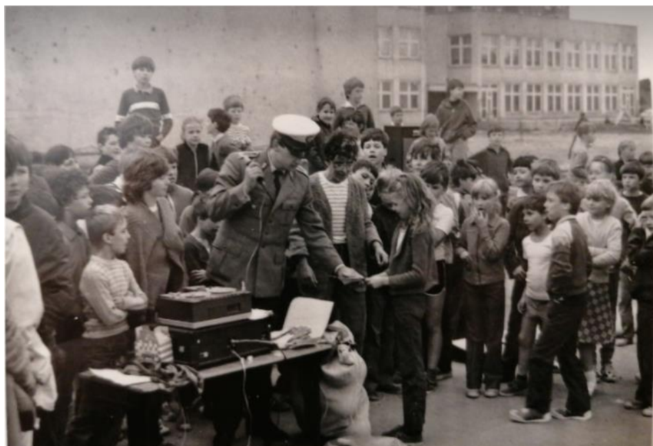
Rys. 18. Egzamin na kartę rowerową, rok szkolny 1982/1983

Nieodłączną coroczną tradycją w naszej szkole od samego początku jej działalności jest egzamin na kartę rowerową. Już od pierwszych lat funkcjonowania szkoły wydarzenie to cieszyło się ogromnym zainteresowaniem wśród uczniów i do dzisiaj wzbudza ogromne emocje. W obecnym roku szkolnym (2021/2022) egzamin ten cieszył się szczególnym zainteresowaniem, wzięły w nim udział klasy 5 i 6. Szczególnie klasy 6 były podekscytowane egzaminem, ponieważ wyczekiwały na niego 2 lata.