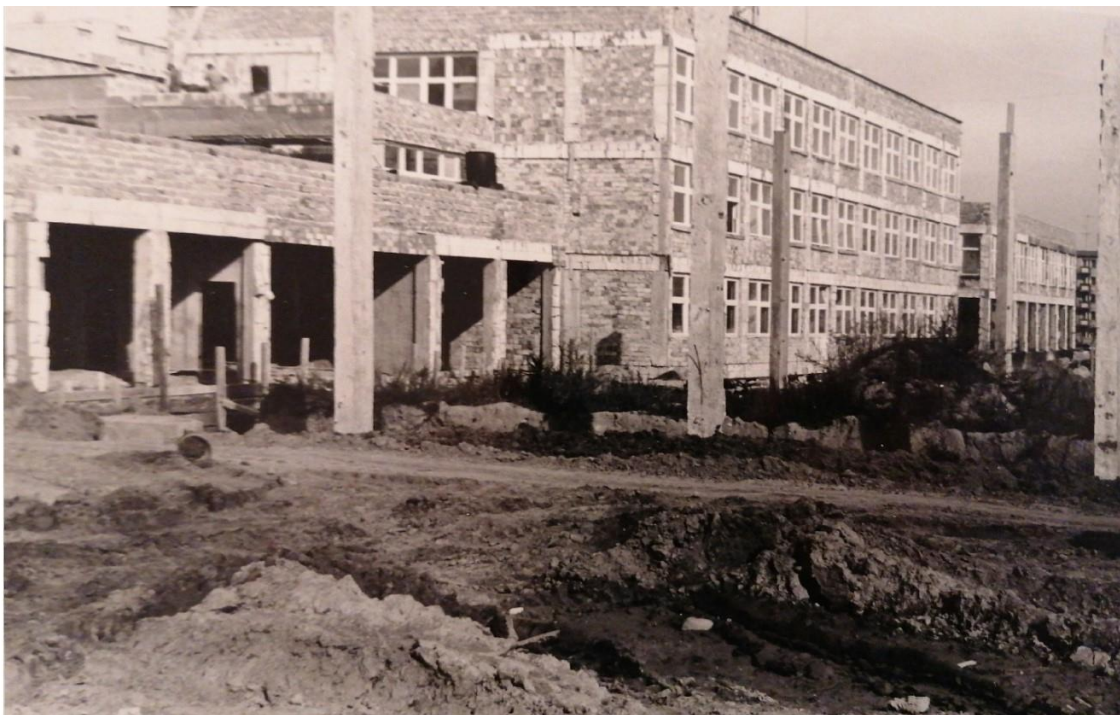
Rys. 1. Budynek szkoły, stan w maju 1981r.

Szkoła Podstawowa nr 16 z siedzibą w Gorzowie Wielkopolskim przy ulicy Dunikowskiego 5 oficjalnie rozpoczęła swoją działalność wyjątkowo 2 października 1981 r. Otwarcie szkoły w tradycyjnym terminie 1 września nie było możliwe, ponieważ budynek był jeszcze w budowie. Na tę szkołę wyczekiwali nie tylko mieszkańcy osiedla Staszica, ale i duża część całego Gorzowa Wielkopolskiego. Szkoły Podstawowe nr 11 i 15 były przepelnione, dlatego tak bardzo zależało wszystkim na jak najszybszym oddaniu w użytkowanie nowego kompleksu budynków. W pracy przy budowie brało udział 200 pracowników. Pomagali wszyscy: wojsko, hufiec OHP, nauczyciele, rodzice i dzieci. Już w maju było wiadomo, że rozpoczęcie roku szkolnego nie odbędzie się w klasycznym terminie, istniał bowiem dopiero jeden segment (A), ostatecznie szkołę otwarto zgodnie z planem, czyli miesiąc później.