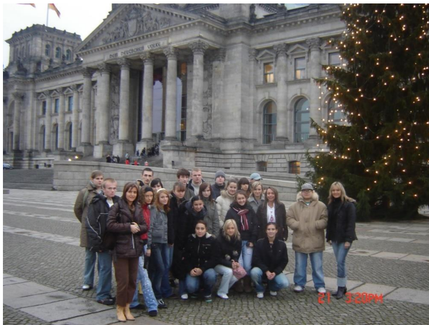
Rys. 26. Jedna z cyklicznych wycieczek w ramach projektu „Świąteczny Berlin

W latach 2001-2012 dodatkowo co roku odbywała się wycieczka szkolna do Berlina pod hasłem „Świąteczny Berlin”. Wycieczka ta, jak sama nazwa wskazuje, miała miejsce w okolicach świąt Bożego Narodzenia. Uczniowie zwiedzali miasto, muzea, jarmark bożonarodzeniowy, a także mogli osobiście doświadczyć świątecznej atmosfery panującej w Berlinie.