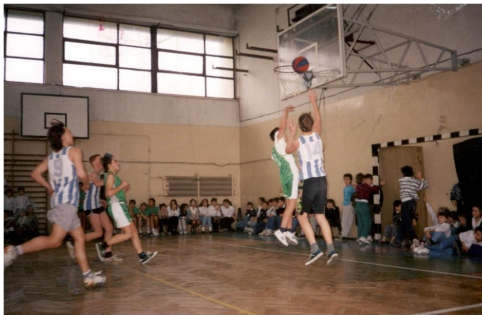
Rys. 34. 10.11.1993 – wznowiony Turniej o Puchar Dyrektora SP 16

W roku 1993 powrócono do dawnej tradycji turniejów koszykarskich o Puchar Dyrektora SP 16 – 10.11.1993 odbył się taki turniej chłopców z okazji Święta Niepodległości i zwycięstwo tradycyjnie padło w nim łupem gospodarzy.