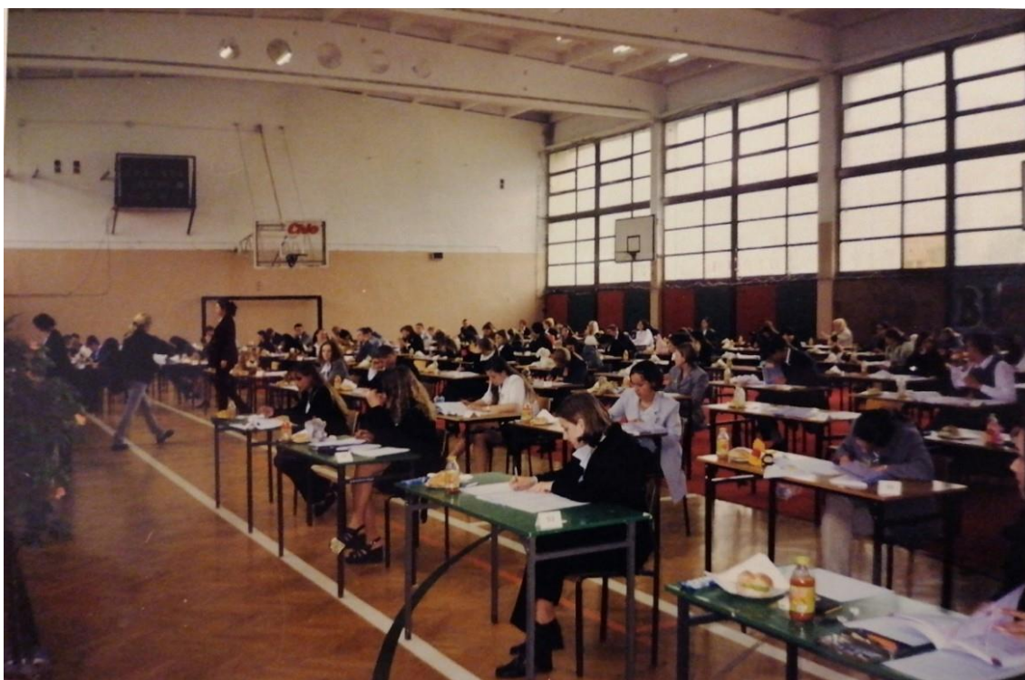
Rys. 11. Pierwszy egzamin maturalny odbył się 11.05.1999 r. na sali gimnastycznej, do egzaminu przystąpiło 107 osób

Od 01.09.1996 r. do chwili obecnej na mocy uchwały organizuje się w Zespole Szkół Ogólnokształcących nr 16 zespoły integracyjne. Klasy z zespołami integracyjnymi były i są wspólną formą rozwoju oraz szansą dla dzieci niepełnosprawnych na normalne funkcjonowanie zarówno w szkole, jak i później w społeczeństwie. Już pierwszy rok działalności zespołów integracyjnych w szkole był bardzo intensywny. Utworzono je w klasach pierwszych, drugich, siódmych i w klasie pierwszej liceum. W każdym takim oddziale uczyło się 18 osób, z czego 5 stanowili niepełnosprawni. Gabinety dla szkół podstawowych specjalnie zorganizowano na parterze, przy pomieszczeniach pedagoga, lekarza i logopedy, a także przy specjalnie dostosowanych toaletach. Klasa licealna miała swój gabinet na pierwszym piętrze, nie było to jednak przeszkodą, gdyż w tym oddziale nie było dzieci z dysfunkcją kończyn. Szkoła otrzymała pieniądze z Państwowego Funduszu Rozwoju Osób Niepełnosprawnych, za które zakupiono łóżko z osprzętem do ćwiczeń fizycznych. Piłki, specjalne klocki, materace, drabinki, sprzęt do zajęć manualnych przekazała nieodpłatnie Poradnia Wychowawczo-Zawodowa przy ul. Piłsudskiego. W szkole stworzono podjazdy, które miały ułatwić poruszanie się uczniom niepełnosprawnym. Złożono także prośbę o dofinansowanie na mikroautobus, którym niepełnosprawne ruchowo dzieci miały dojeżdżać do szkoły. Placówka cieszyła się ogromnym zainteresowaniem rodziców niepełnosprawnych dzieci.