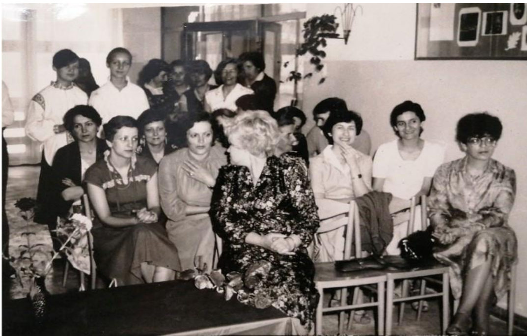
Rys. 7. Część grona pedagogicznego, rok szkolny 1982/1983