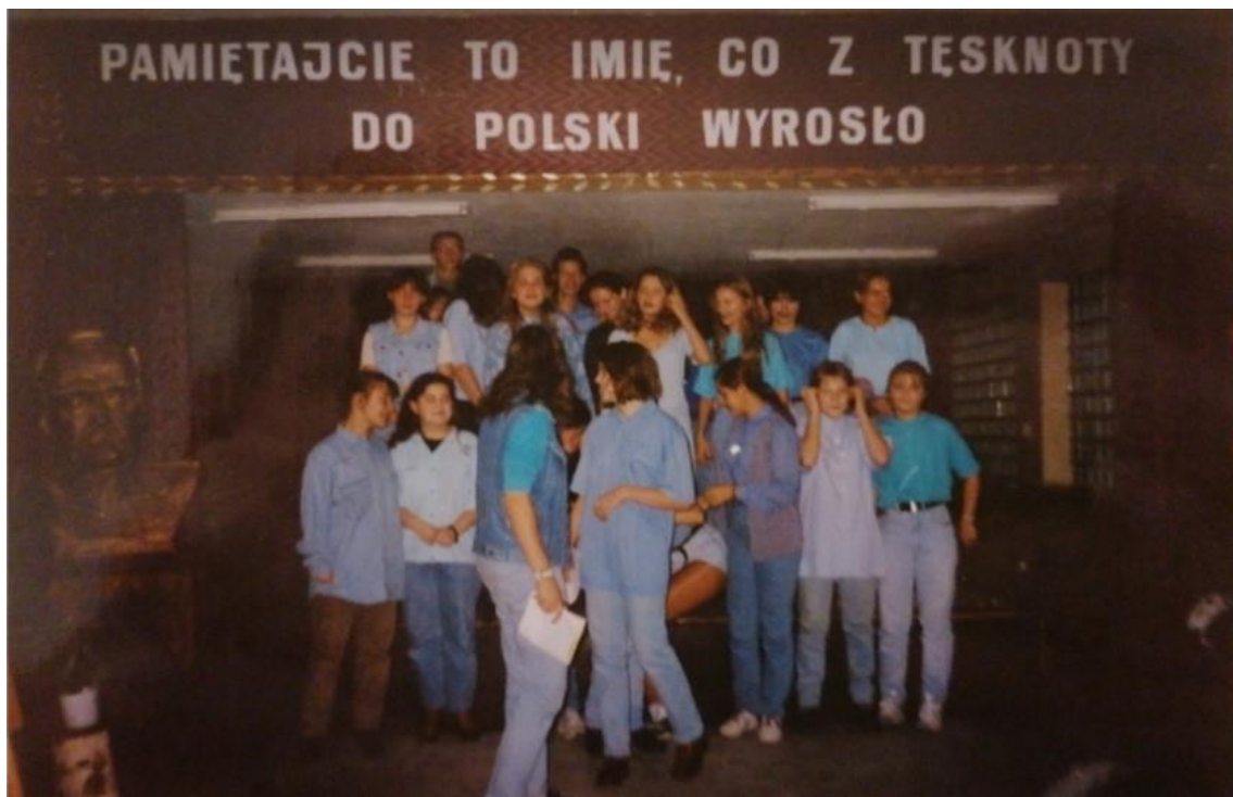
Rys. 10. Uczniowie klasy Ic podczas otrzęsin

Wraz z reformą oświaty przyszła kolejna zmiana w naszej szkole. Rada Miejska w Gorzowie Wielkopolskim dnia 31.03.1999 r. postanowiła utworzyć publiczne Gimnazjum nr 8 przy Zespole Szkół Ogólnokształcących nr 6 w Gorzowie Wielkopolskim. Uchwała weszła w życie z dniem 01.09.1999 r., czyli wraz z rozpoczęciem nowego roku szkolnego.