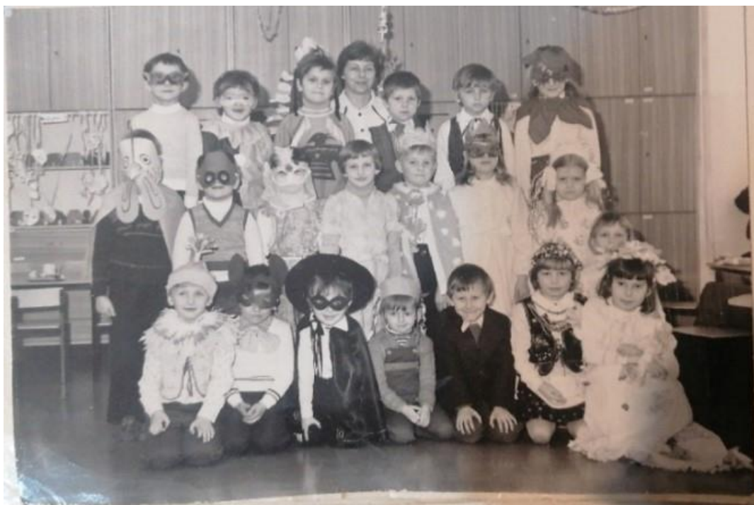
Rys. 2. Jeden z pierwszych oddziałów przedszkolnych przy Szkole Podstawowej nr 16

Do szkoły 05.10.1981r. zapisanych było 1117 uczniów podzielonych na 41 oddziałów i 131 uczniów w ośmiu ogniskach przedszkolnych. Było aż 10 pierwszych klas, a pierwsi absolwenci mieli opuścić mury szkoły dopiero w 1983 r.