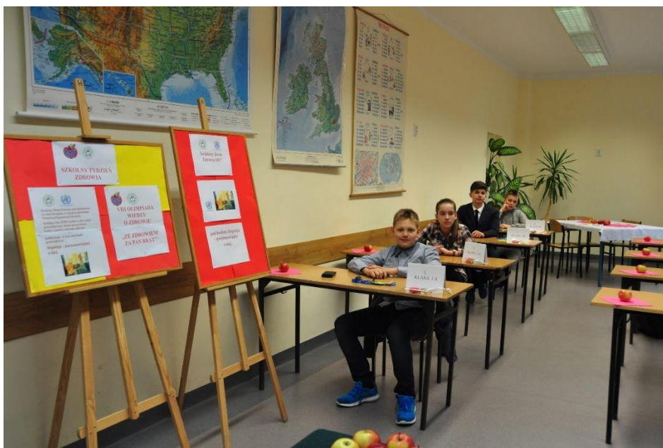
Rys. 45. Nasi uczniowie podczas olimpiady wiedzy o zdrowiu