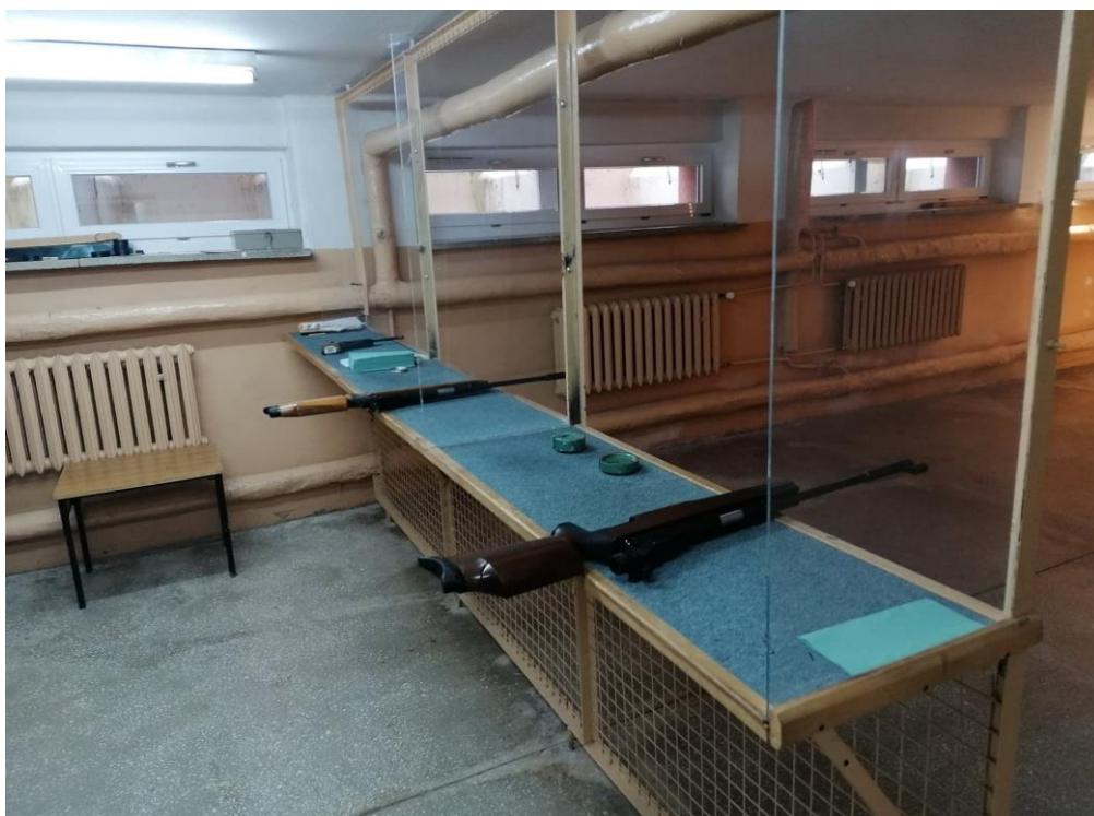
Rys. 37. Strzelnica szkolna