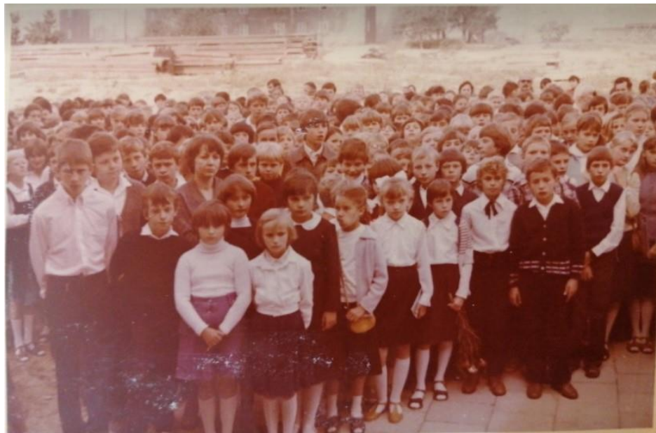
Rys. 5. Uczniowie 01.09.1982 r. na placu przed szkołą

Kolejny rok szkolny 1982/1983 rozpoczął się już pierwszego września, ale nie w formie zgodnej z powszechnym wyobrażeniem. Dalej nie było sali gimnastycznej ani boiska szkolnego, więc oficjalna część uroczystości miała miejsce na placu przed szkołą.