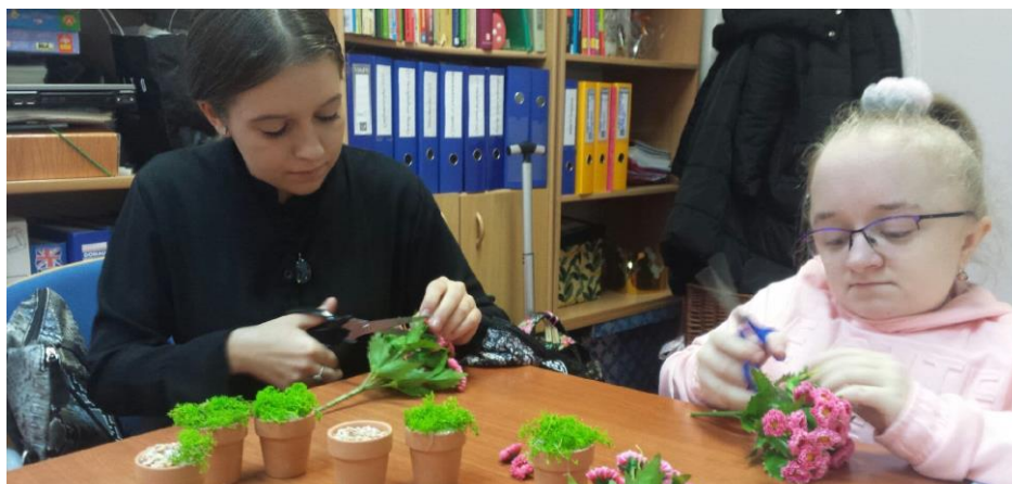
Rys. 49. Uczennice klasy II liceum przygotowują drobne upominki dla medyków w ramach podziękowania za ich pracę w tym trudnym czasie

Ponieważ jednak tylu rodziców, nauczycieli i uczniów życzyło nam sukcesu, trzeba było wykorzystać ten potencjał. Akcja „plan B”, czyli ... bo warto czytać! przerosła najśmielsze oczekiwania nauczycieli bibliotekarzy - biblioteka wzbogaciła się o ponad 150 najnowszych, wymarzonych książek. Rozgłos, który biblioteka dzięki tej akcji przyniosła szkole, odbił się szerokim echem nie tylko w Gorzowie Wlkp., ale też pisano o nas w ogólnopolskim miesięczniku Biblioteka w Szkole (4-5-6/2020).