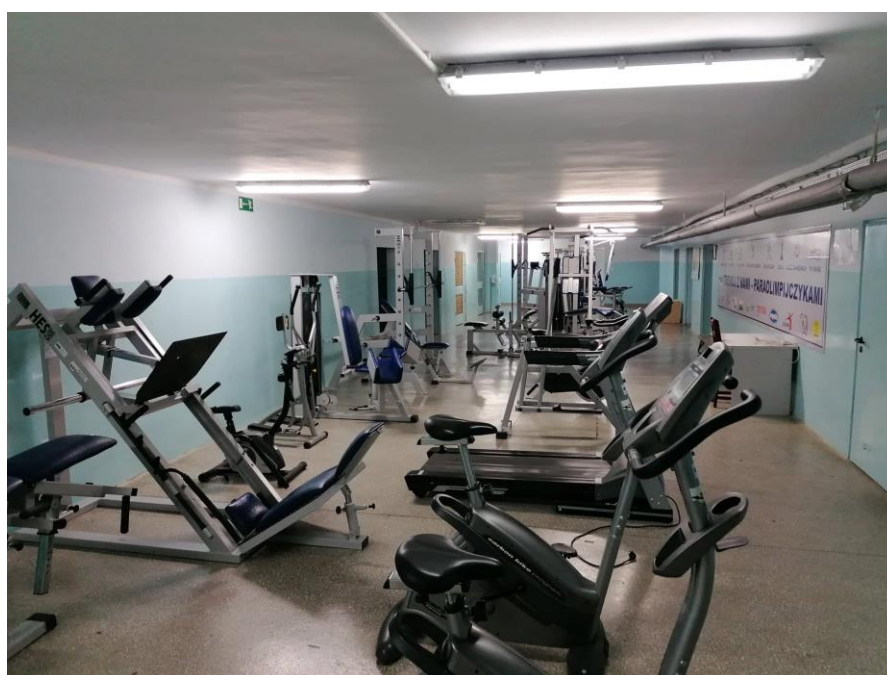
Rys. 35. Część naszej siłowni szkolnej