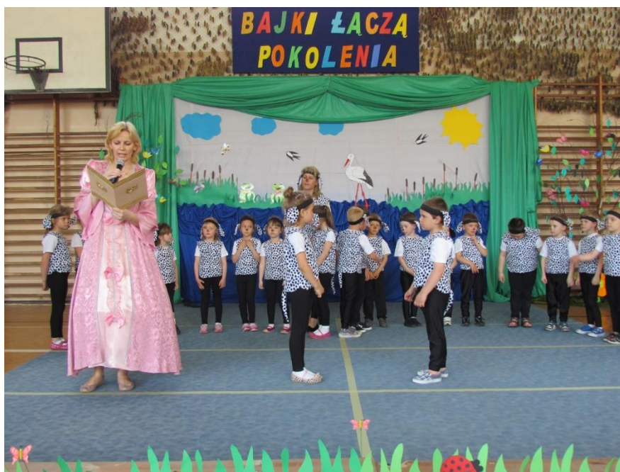
Rys. 43. Projekt przedszkolny pt. „Bajki łączą pokolenia”

W szkole funkcjonuje także Szkolny Klub Wolontariusza „Iskierka”. W okresie 20 lat istnienia szkolnego wolontariatu w jego działaniach charytatywnych w poszczególnych latach aktywnie uczestniczyło bardzo wielu wolontariuszy, którzy po skończeniu szkoły podstawowej, gimnazjum czy liceum, nadal w swoim już dorosłym życiu zajmują się aktywnie pracą charytatywną i społeczną na rzecz innych ludzi. Tu, w naszej szkole, zaangażowali się w różne formy pomocy i ta wrażliwość, empatia na potrzeby innych pozostała im i dalej pomagają w różnych placówkach, instytucjach, świetlicach, stowarzyszeniach, szkołach.