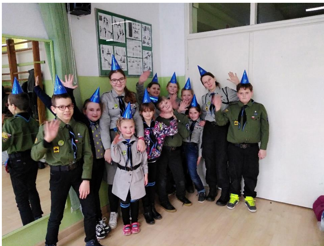
Rys. 14. Gromada zuchowa „Łaziki”

Zuchy zorganizowały kilka zbiórek publicznych oraz kiermaszy w szkole. Dzięki pracy własnej, wsparciu okolicznych mieszkańców, rodziców, dyrekcji szkoły i nauczycieli możliwe było zebranie środków, dzięki którym Łaziki między innymi pojechały na wycieczkę do Międzyrzeckiego Rejonu Umocnionego. Otrzymaliśmy także w prezencie gry karciane i planszowe od Stowarzyszenia Novum. Sami pozyskaliśmy wiele gier, realizując projekt w ramach Rządowego Programu Wsparcia Rozwoju Organizacji Harcerskich i Skautowych.