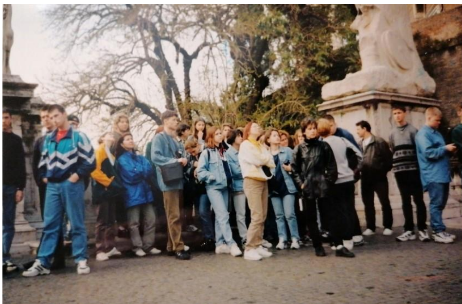
Rys. 25. Uczniowie VIII LO na dziedzińcu klasztoru benedyktyńskiego. Wycieczka do Włoch 18-25.03.1997 r.

Najciekawszą formą aktywności szkolnej i jednocześnie najbardziej wyczekiwaną przez wszystkich uczniów jest wycieczka szkolna. Nasza szkoła już od pierwszych lat swojej pracy zwraca na tę działalność szczególną uwagę, zarówno jeśli chodzi o wycieczki jednodniowe, jak i o wycieczki kilkudniowe. Pierwsze wycieczki szkolne ze względu na sytuację polityczną odbywały się na terenie kraju, jednak z czasem, po 1989 r., szkoła zaczęła organizować liczne wyjazdy zagraniczne, do różnych państw europejskich, w tym chociażby do Anglii, Hiszpanii czy Włoch. Te właśnie wycieczki zagraniczne cieszą się największą popularnością wśród naszych uczniów.