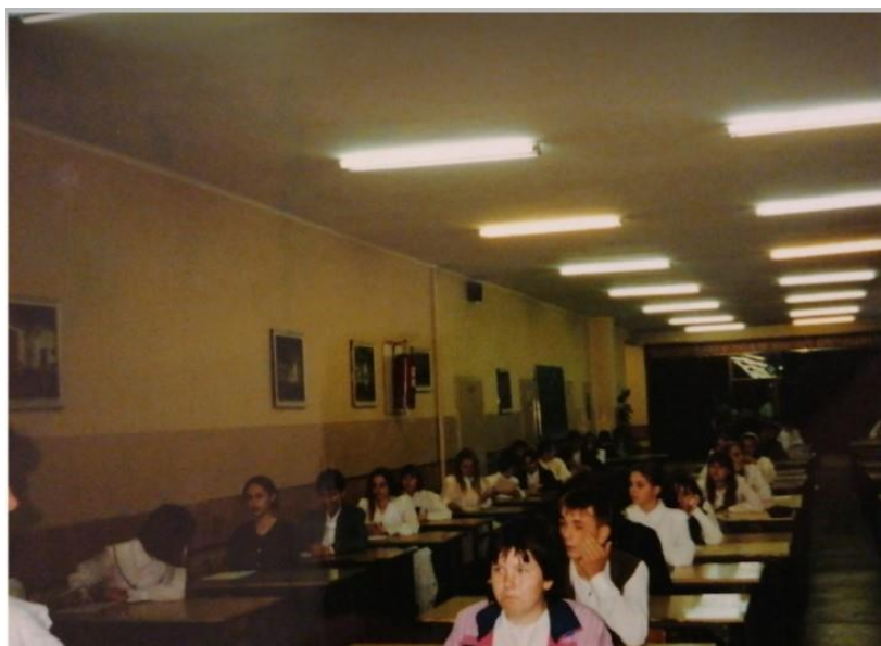
Rys. 9. Uczniowie starający się o przyjęcie do VIII liceum, nowej szkoły średniej w Gorzowie Wielkopolskim, na egzaminie wstępnym

Szkoła Podstawowa nr 16 cały czas prężenie działa, jest ona aktualnie częścią Zespołu Szkół Ogólnokształcących nr 16. Po przemianach ustrojowych w 1989 r. i wejściu w życie w 1991 r. ustawy o systemie oświaty i wychowania, zarząd miasta Gorzowa Wielkopolskiego złożył projekt ustawy w sprawie reorganizacji Szkoły Podstawowej nr 16 w Gorzowie Wielkopolskim i utworzenia w niej Liceum Ogólnokształcącego nr 8. Od 01.09.1995 r. przy ulicy Dunikowskiego 5 znajdował się Zespół Szkół Ogólnokształcących nr 6. Rada Miejska taką decyzję argumentowała na wiele sposobów. Stale rozwijające się osiedle Staszica, duży budynek szkolny oraz malejąca liczba uczniów od roku szkolnego 1998/1999 stały się istotnym czynnikiem przemawiającym za tym, aby utworzyć liceum. Nie bez znaczenia też był fakt,