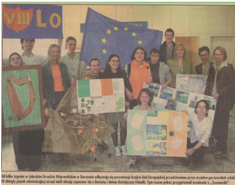
Rys. 22. Wycinek z gazety opisujący udział naszej szkoły w projekcie Urzędu Wojewódzkiego