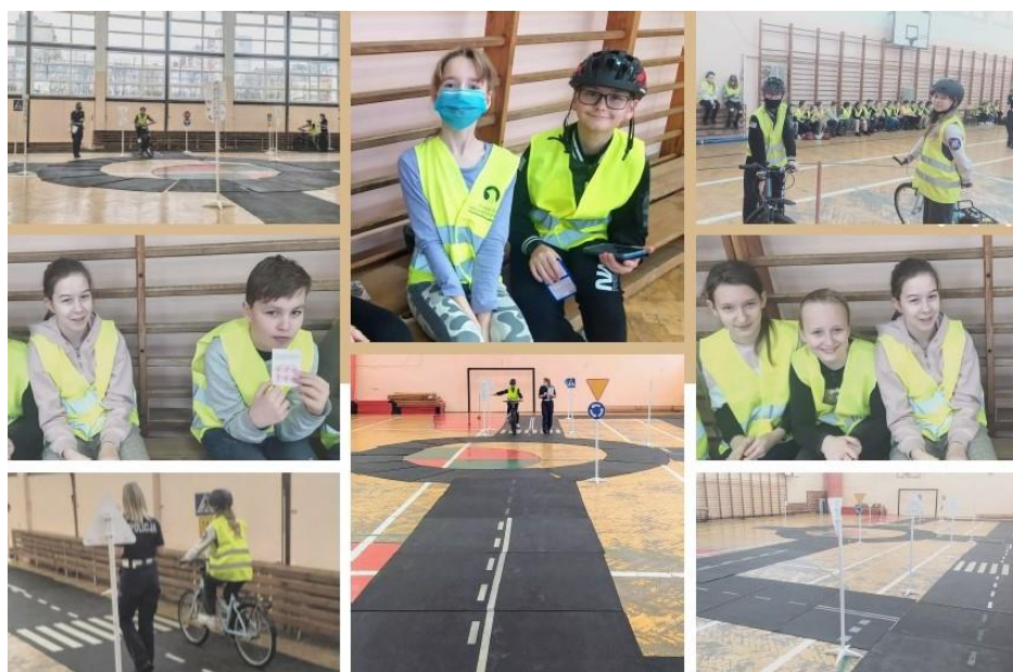
Rys. 19. Egzamin na kartę rowerową rok szkolny 2021/2022