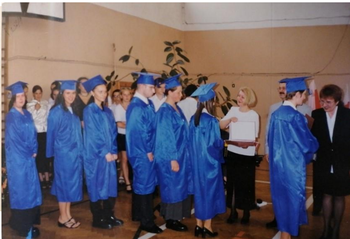
Rys. 29. Zakończenie roku szkolnego dla pierwszych absolwentów VIII Liceum Ogólnokształcącego