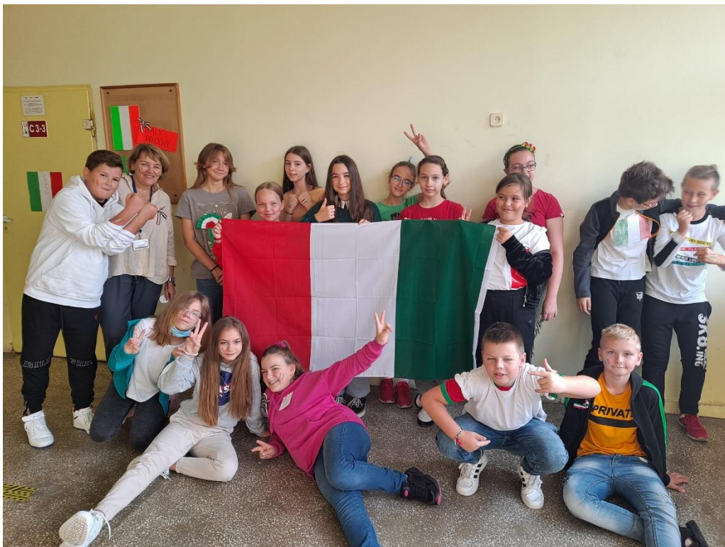
Rys. 24. Uczniowie klasy 5a świętują Dzień Języków Obcych, rok szkolny 2021/2022