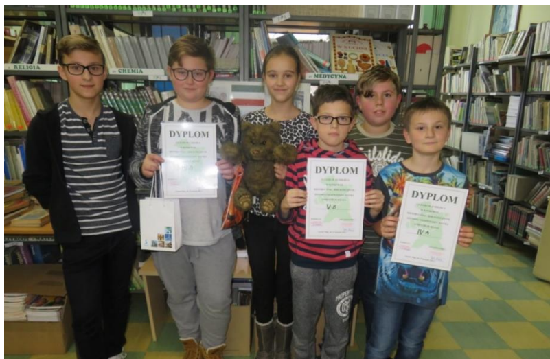
Rys. 50. Rok 2014, jeden z konkursów organizowanych w ramach Międzynarodowego Miesiąca Bibliotek Szkolnych