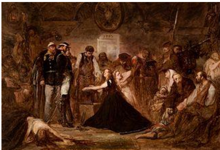
Polonia- Rok 1863, Jan Matejko