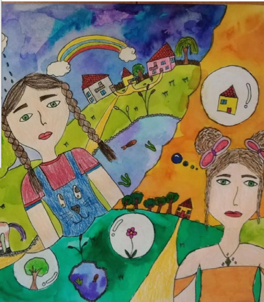
Hudák Sára – 5. osztály