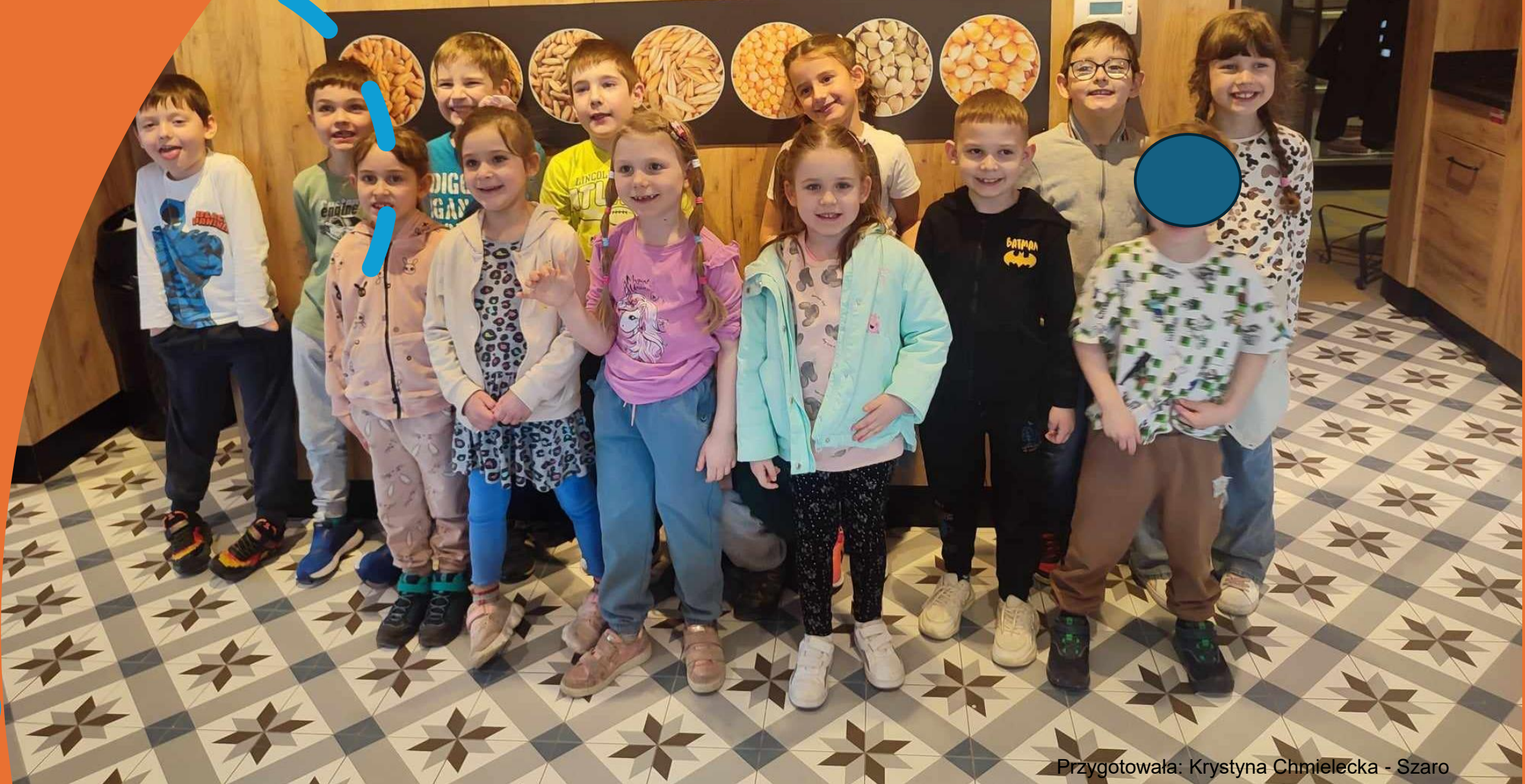
Przygotowała: Krystyna Chmielecka - Szaro

PSZENICA JĘCZMIEN ŻYTO OWIES PROSO GRYKA KUKURYDZA